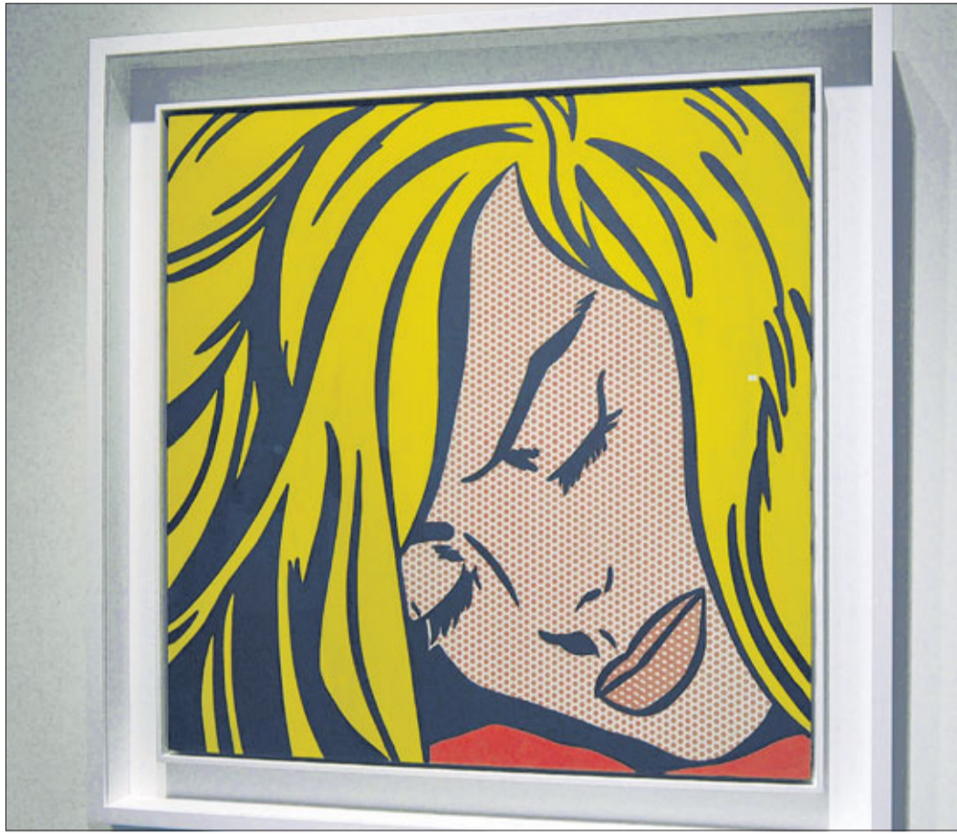
Das «Sleeping Girl» des Roy Lichtenstein ist bei Sotheby's in New York für fast 45 Millionen Dollar verkauft worden und markiert damit einen Rekord für ein Bild des Pop-Art-Künstlers.

Während in Internetforen noch über den Deal geschimpft wurde („unsozial“), gab es weitere Rekorde. Bei Christie's waren es am Dienstagabend