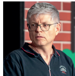
Regie Ernst Stahlhut